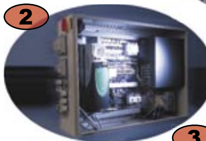
2 Huvudskåp med elcentral och Windowsbaserad industri-PC