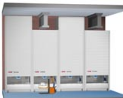
TORNADO - anpassad till byggnadens takkonstruktion