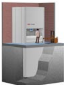
TORNADO - uppbyggd med bas i källarplan