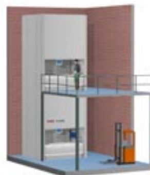
TORNADO - med plockning i flera nivåer