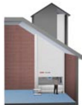
TORNADO - med utökad takhöjd

Kontakta oss för behovs- och payback analys. Vårt expertteam står till ditt förfogande.