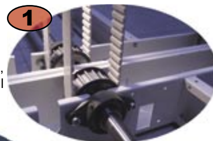
1 Detalj från drivaxel, drev och kuggjul