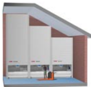
TORNADO - anpassad för varierande takhöjd