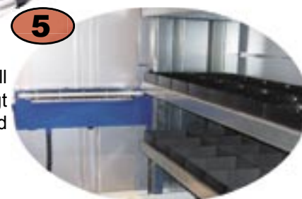
5 Lyftdon med horisontell kuggrem ersätter tungt hissbord