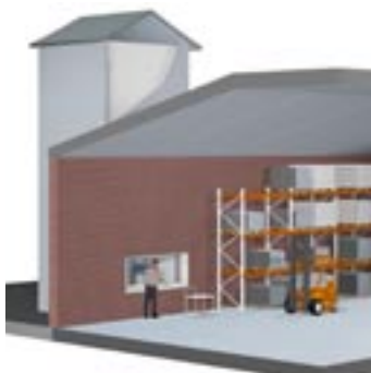
TORNADO - placerad utomhus med in- och utlastningsstation inomhus