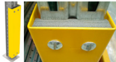
Stolpskydd med skum Stolpskydd med ett stötabsoberande skum inuti.