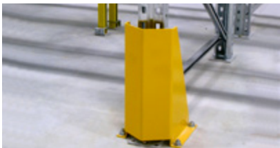
Golvmonterade skyddskolonner Skyddar pallställens stolpar.

Varje lagringsmetod innebär en dynamisk miljö med konstant produktrotation och gaffeltruckar som rör sig snabbt över golvet. Detta ger ofta upphov till skador på ställen, något som kan undvikas med hjälp av våra specialdesignade skyddsanordningar.