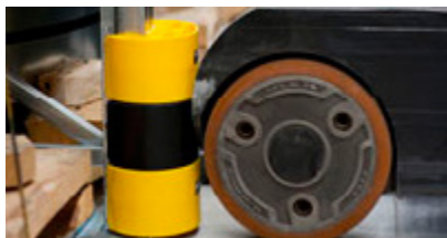
Skyddskolonner med snäppfäste Absorberar hårda sammanstötningar och fästes på en stolpe utan extra fästeanordningar.