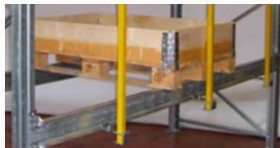
Genomskjutningsskydd Förhindrar pallar från att falla av från ställens baksida.