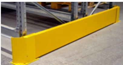
Gavelskydd Idealisk för att skydda utsatta områden från sammanstötningar med truck.